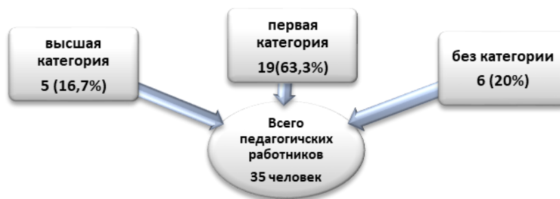
Рисунок 2. Качественная и количественная характеристика педагогов

Количество педагогов школы, имеющих квалификационные категории по итогам 2018-2019 учебного года (рисунок 2):