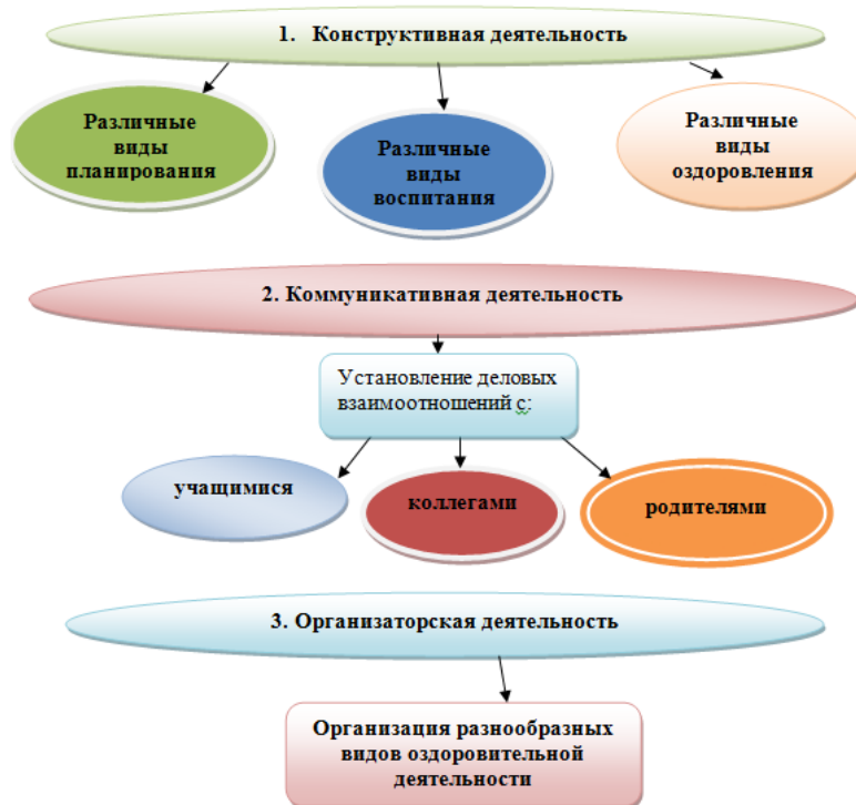
Рисунок 6. Компетентностная модель современного учителя

Компетентностная модель современного учителя представлена на рис. 6.