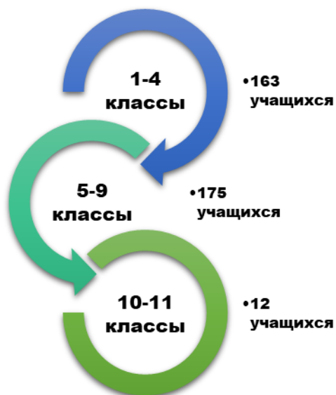
Рисунок 1. Качественная и количественная характеристика учащихся

5-9 классы – 175 учащихся; 10-11 классы – 12 учащихся.