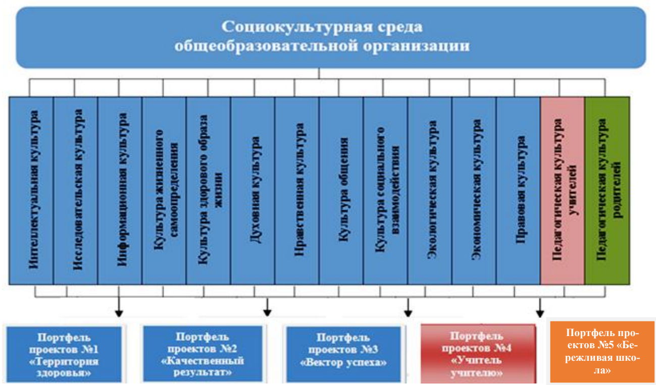
Рисунок 5. Социокультурная среда общеобразовательной организации

Базовая культура личности – сформированность культуры умственного труда, нравственно-эстетических взглядов и убеждений, культуры поведения и нравственной воспитанности, культуры трудовой деятельности, здорового образа жизни, стремления к физическому совершенствованию личности. Базовая культура является основой успешной социализации личности учащихся в современном меняющемся обществе.